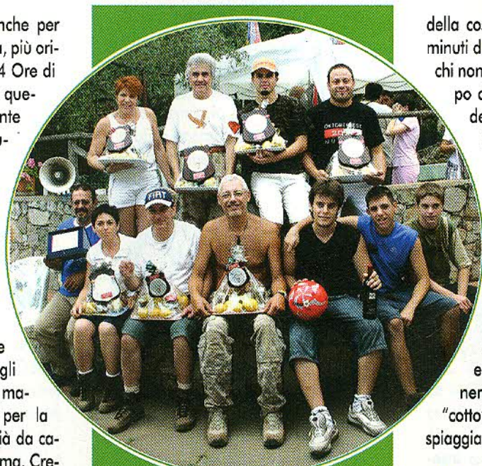
Foto di gruppo dei premiati.