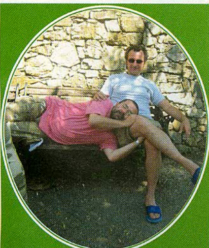
Si schiaccia un pisolino tra una sessione di tiro e l'altra.